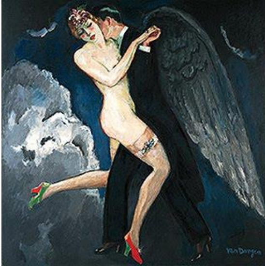
(VAN DONGEN, K., 1922)

sede / que me bebe quente / como um licor / brindando a morte, e fazendo amor». Por otro lado, la narrativa vampírica de los discurso-objeto de las resistencias (narrativas de denuncia), en cambio, podría imaginar al vampiro minero cantando “Vampire blues” de Neil Young al ritmo desenfrenado de la extracción, acaso substituyendo el octane del final del verso por gold, silver, uranium, plutonium o lo que fuera que la mina extrajera: «I'm a vampire, babe, suckin' blood from the earth /