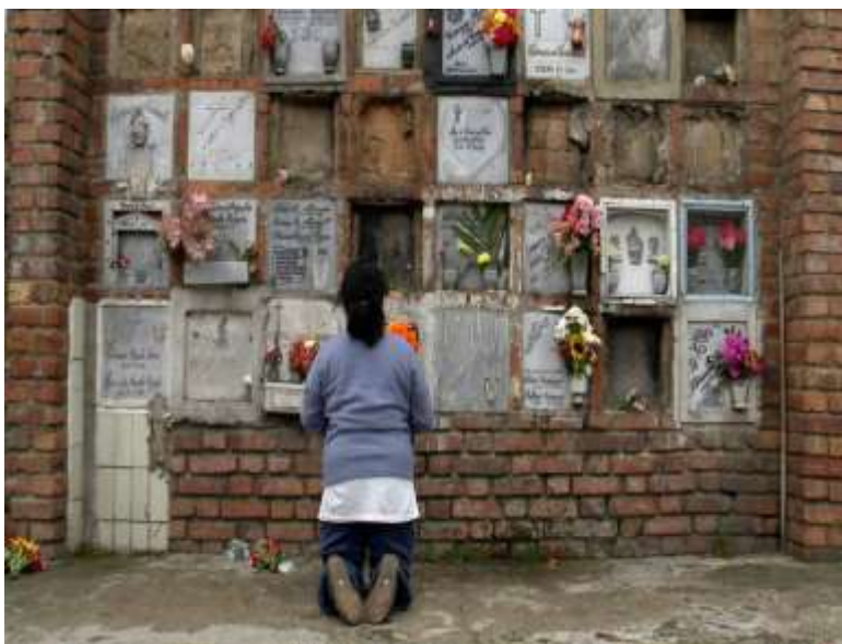
Ilustración 3. Fotograma Noche Herida (2015)

“(...) Ánima mía, ánima de paz y de guerra, ánima de mar y de tierra. Que todo lo que tengo ausente o perdido, se me entregue o se me aparezca (...)” (Rincón, 2015)