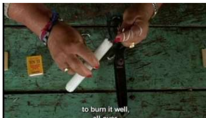
Ilustración 1. Fotograma En lo escondido (2007)

«En el campo colombiano, la noche oscura está poblada de seres de todo tipo. Cuando nada se ve, todo se escucha: las visitas de las brujas, los ruidos de la bestia y los golpes en la puerta»