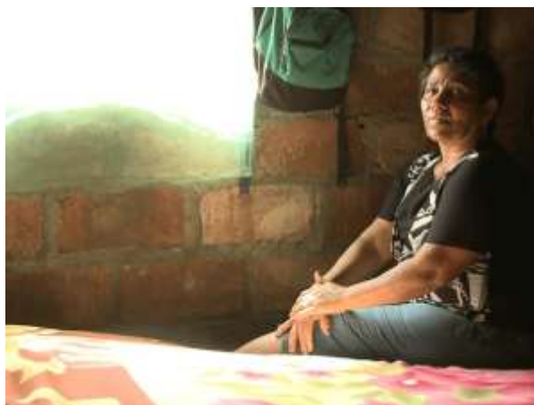
Ilustración 2. Fotograma Los abrazos del río (2010)