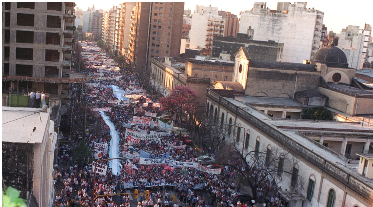
Marcha en defensa de la educación

La profesionalización docente encubría el ataque a los derechos de los trabajadores de la educación y la flexibilidad interna funcional que se empezaba a exigir, pretendía que los docentes cubrieran todas las otras ausencias del estado y suturaran en las comunidades las consecuencias de las agresiones del neoliberalismo como la desafiliación laboral de los adultos y las desarticulaciones familiares.