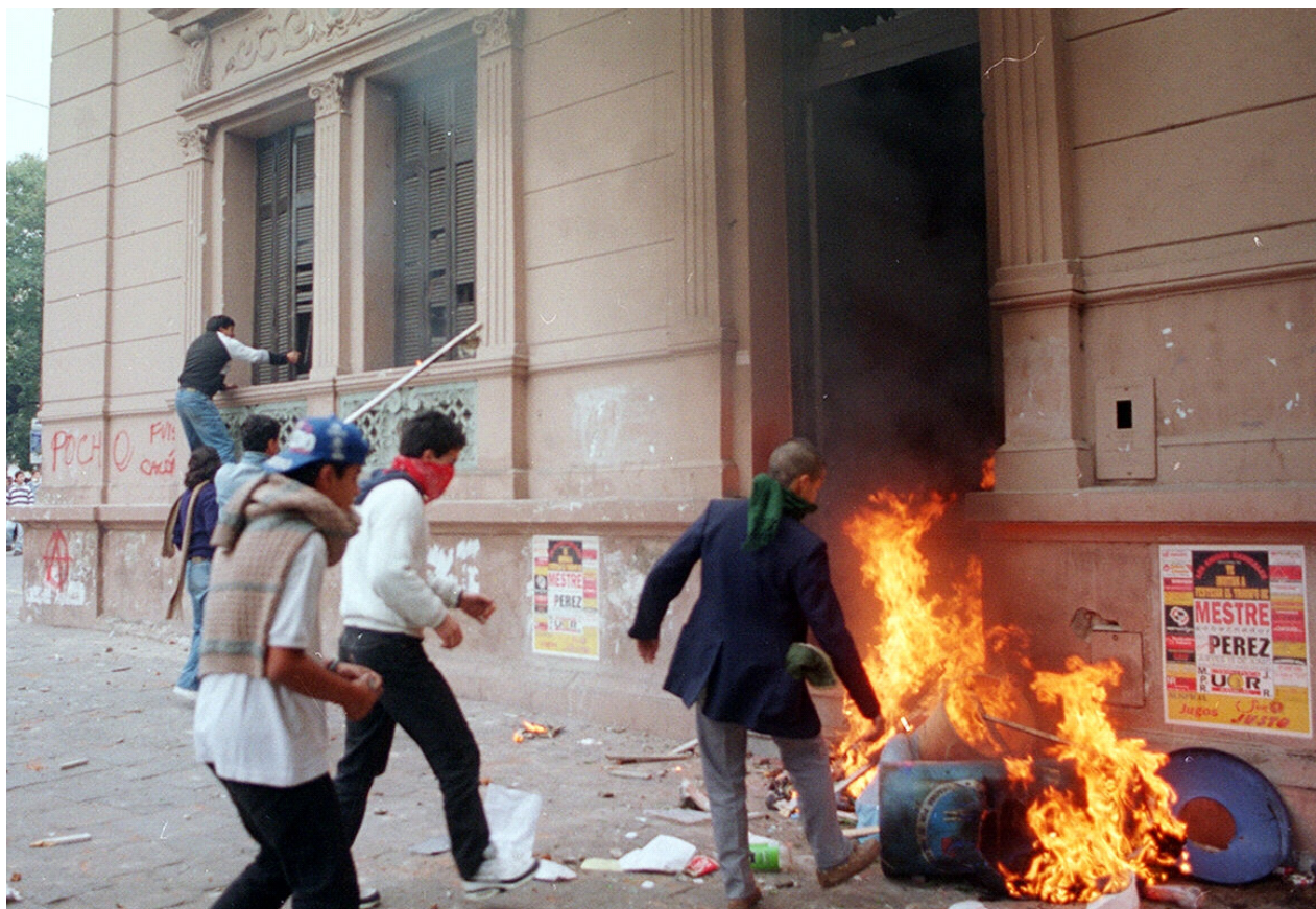
Manifestantes frente a la Casa de la UCR en Córdoba, Foto Gentileza Archivo/ La Voz del Interior