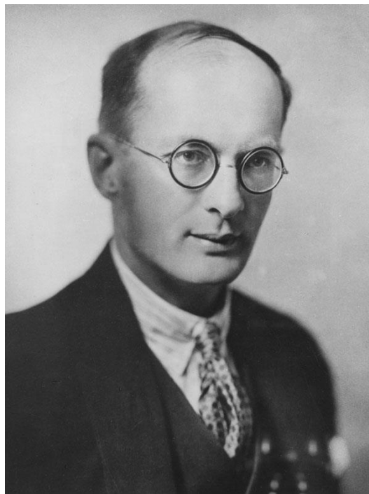
Ilustración 1

Bronislaw Malinowski (1884-1942) nació en Cracovia, Polonia, donde estudió Filosofía, Matemática y Ciencias Físicas. Posteriormente vivió y trabajó en Inglaterra, donde comenzó su inquietud por la Antropología. Es considerado uno de los antropólogos clásicos, fundador de la escuela teórica conocida como Funcionalismo , desde la cual realizó numerosos aportes relevantes al campo de la Antropología como ciencia. Realiza su primer trabajo de campo entre 1915 y 1918 en las Islas Trobriand (Nueva Guinea), ubicadas en el suroeste del océano Pacífico. Esto le implicó desplazarse desde Inglaterra, salir de la ciudad de Londres donde residía, embarcarse y partir hacia la gran aventura de conocer tierras y poblaciones extrañas. Se destaca su estudio sobre el Kula, concepto a partir del cual pudo analizar un complejo sistema de intercambios entre los nativos con diversos sentidos religiosos, sociales, mágicos y comerciales.