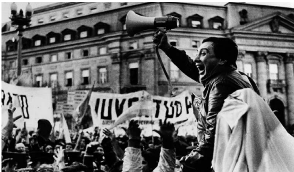
Saúl Ubaldini, líder de la CGT, encabezando el acto en Plaza de Mayo.

Hacia 1982, el dictador Leopoldo Galtieri encabezaba el gobierno en un contexto con diversos frentes conflictivos: una crisis económica de gran magnitud, un sindicalismo que se reorganizaba y accionaba públicamente desafiando a la represión, y partidos políticos que retomaban su actividad pública y coordinaban acciones para enfrentar a la dictadura a través de la Multipartidaria, organización creada en 1981, que reunió a los principales partidos políticos del país. Paralelamente, los organismos de Derechos Humanos hacían sentir su voz cada vez más fuerte, tanto dentro del país como en el exterior, por lo que gobiernos de diferentes países comenzaron a presionar al gobierno argentino frente la violación sistemática de los derechos humanos. Además, en ese momento, empezaron a volverse visibles las consecuencias negativas del plan económico adoptado por la dictadura.