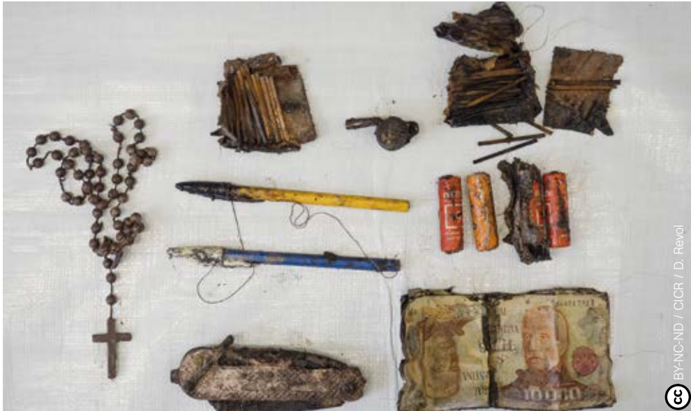
Objetos personales de soldados sepultados en el cementerio de Darwin hallados en 2017.

Por último, pero no menos importante, recordar Malvinas supone reconocer el carácter diverso de la Argentina, las modalidades propias en que se entonan y se imprimen en las distintas localidades del país los recuerdos de la guerra, que muchas veces también dan cuenta del modo en que se experimentó el conflicto en cada región del país. Por la vía de un reclamo común, entonces, las Malvinas también nos enseñan acerca del carácter profundamente federal de la República Argentina.