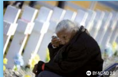
Secretaría de Derechos Humanos y Pluralismo Cultural de Argentina

Se produce la identificación de los restos de 88 soldados caídos en Malvinas, enterrados en el Cementerio Militar de Puerto Darwin, gracias al trabajo del Equipo Argentino de Antropología Forense y el Comité Internacional de la Cruz Roja.