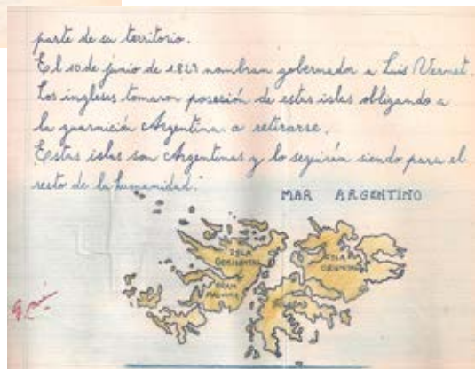
Escribir cien veces: son nuestras. Muestra temporaria curada por el Museo de las Escuelas y el Museo Malvinas e Islas del Atlántico Sur.