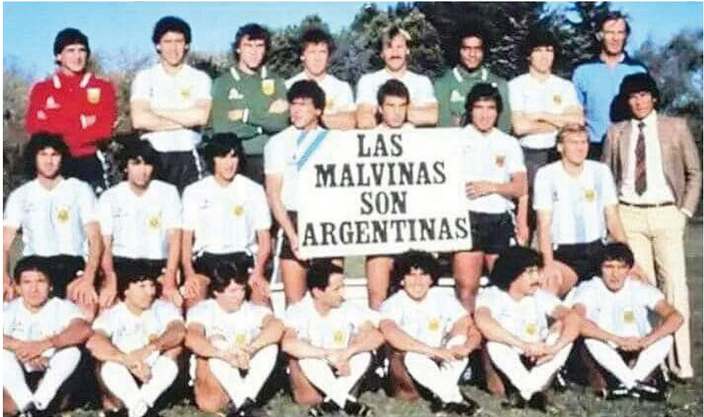
Los jugadores de la selección argentina posan antes del Mundial de España de 1982 apoyando el reclamo de soberanía.

a las memorias de Malvinas los trabajos de un duelo colectivo que asume formas específicas en cada rincón del país.