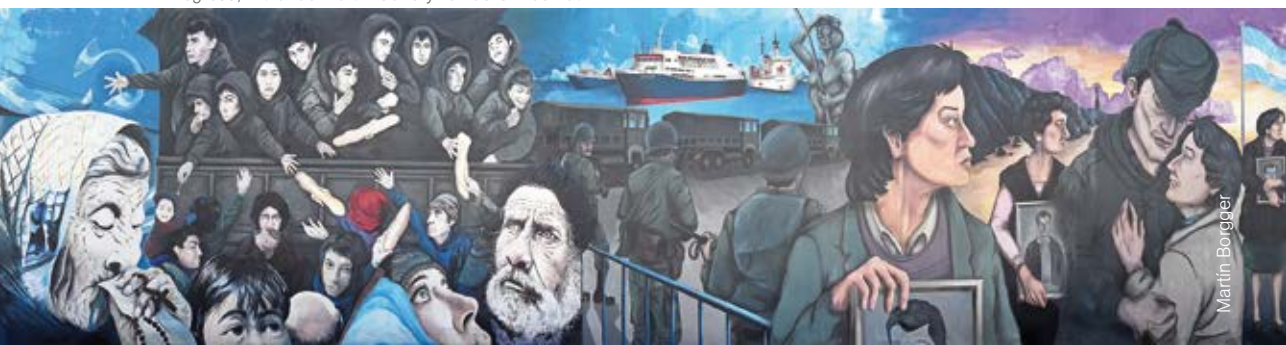
El Regreso, mural de Martín Cofre y Tomás Gimbernat.

Finalmente, a partir de la búsqueda de imágenes documentales de la época, puede proponerse reflexionar sobre la utilización de las expresiones artísticas como los murales para abordar la memoria. Las preguntas que podrían guiar esta tarea podrían ser: ¿Estas imágenes son réplicas, reconstrucciones o memorias de lo ocurrido? ¿Qué elementos, recursos expresivos, enfoques, planos, collage de imágenes, combinación de escenas, etc. utilizan los autores en este mural para contar una historia?